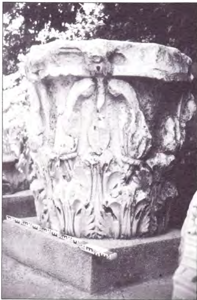
LÁMINA VIII. Capitel corintio del templo.

Otro dato proporcionado por investigaciones recientes es el relativo a la presencia de un acueducto conocido como Aqua Nova Domitiana Augusta , gracias al hallazgo de una inscripción aparecida en un solar de la calle S. Pablo, a escasos 40 m. de la puerta oriental de la ciudad y estudiada por Stylow 32 . Este documento supone la existencia de una conducción de agua construida o al menos inaugurada bajo el mandato de Domiciano con la probable finalidad de garanti-